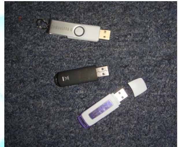
Standard USB drives